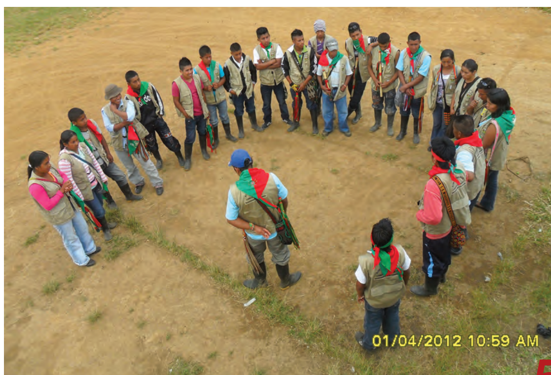
Taller de defensa territorial. Munchique. Colombia