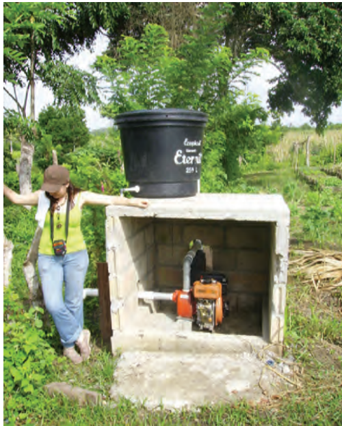
Planta potabilizadora de agua. Antioquia, Colombia

Asímismo seguimos participando en cursos de formación y en trabajos de análisis e investigación. Profundizamos nuestra relación con nuestras contrapartes y apoyamos el desarrollo de proyectos de cooperación tanto en el suroccidente como en el sur de Bolívar.