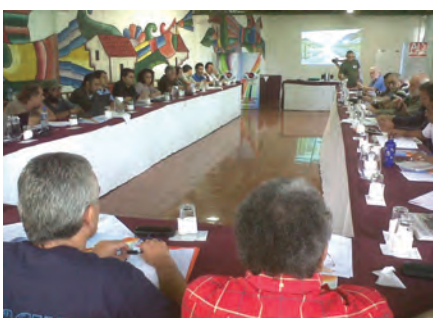
Izquierda: Seminario internacional: "La gobernanza mundial. Caracterización de la crisis global y sus perspectivas". La Palma. El Salvador (3/8/12)

Entre otras actividades, OMAL organizó la quinta edición del curso universitario "Repensar el Desarrollo. Cooperación, derechos humanos y empresas transnacionales" en colaboración con la Universidad Complutense de Madrid, que tuvo lugar en el campus de Somosaguas entre los días 12 y 14 de abril. En el mes de marzo, se llevaron a cabo en la Universidad de Sevilla y en la Universidad de Córdoba sendas jornadas sobre "El papel de la cooperación andaluza y las empresas multinacionales españolas en el desarrollo y cumplimiento de los derechos humanos en Centroamérica". Así, entre los días 20 y 21 de marzo se presentó la publicación "La Ayuda Oficial al Desarrollo de Andalucía en Centroamérica. Un estudio de la cooperación andaluza 2008-2010". El día 13 de junio se presentó el libro Pobreza 2.0 en el Ateneo de Madrid, presentación a la que se sucedieron otras en el segundo semestre en Córdoba, La Paz (Bolivia) y Bilbao.