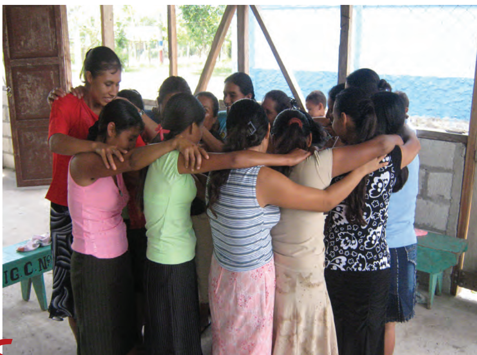
Fortalecimiento de los espacios de autonomía de las mujeres. Guatemala