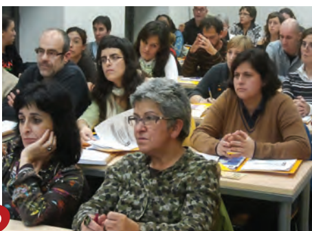
Curso: “Crisis global y empresas transnacionales”. Hegoa-UPV/EHU. Bilbao (12-16/11/12)

E l objetivo del seminario, que se celebró entre los días 12 y 13 de junio en Madrid, era crear un espacio de reflexión y debate sobre las nuevas tendencias y propuestas sobre el concepto de desarrollo. Para ello se invitó a representantes de ONGD, administraciones públicas, universidad y organizaciones sociales y sindicales. Los ejes de análisis que se abordaron fueron: internacionalización de las economías como motor de crecimiento, desarrollo vs. crecimiento y el papel del sector privado en la agenda oficial de la cooperación internacional. También se consideró imprescindible crear una mesa de debate sobre la posibilidad de repensar y construir alternativas al actual modelo de desarrollo.