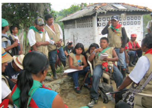
Izquierda: Taller de resistencia comunitaria. Colombia