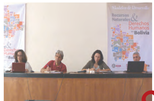
Derecha: Curso "Modelos de desarrollo recursos naturales y derechos humanos en Bolivia" Cochabamba. Bolivia (20-21/9/12)