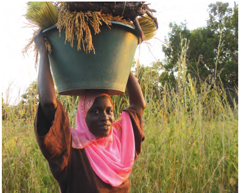
Proyecto de autonomización de mujeres y soberanía alimentaria en la región del Foudalou. Senegal