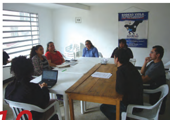
Reunión con sindicalistas colombianos