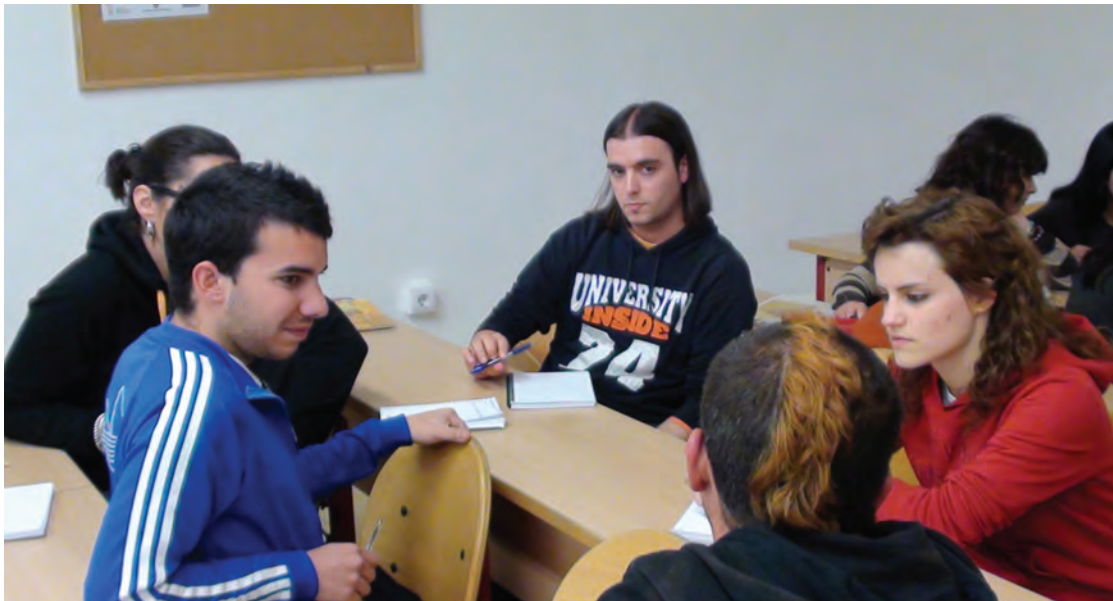
Taller Cine y derechos humanos: Campus de Badajoz, Universidad de Extremadura (22/3/12)

Así, además del trabajo referente a los proyectos de cooperación en marcha, nos hemos centrado en las actividades de educación para el desarrollo (EpD, también sensibilización) en el campus de Badajoz de la Universidad de Extremadura (taller de cine y derechos humanos, exposición "África Otras Miradas"...), en la Biblioteca pública de Cáceres (exposición "América Latina. Necesitamos soñar", cine forum derechos humanos...), en el Foro por la Paz, en la campaña Pobreza Cero, participación en el grupo de local de cooperación de Cáceres, en diferentes acciones de la Coordinadora de ONGs para el Desarrollo de Extremadura (grupo de EpD, encuentro de agentes sociales, día mundial de los scouts Jamboreex...) y la participación activa en la Plataforma 2015 y más. Asimismo, desde Extremadura aportamos contenidos a la revista Pueblos.