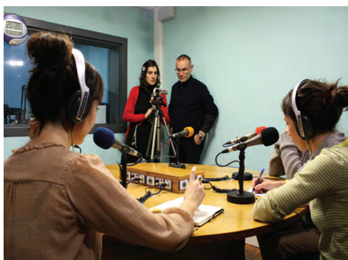
Talleres de radio y vídeo organizados en colaboración con Tas-Tas Irrati Librea. Bilbao. (12/2012)