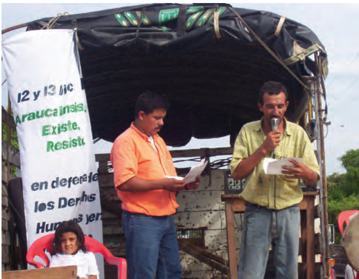
Abajo: Fotografías de proyectos desarrollados en los departamentos de Arauca y Cauca. Colombia