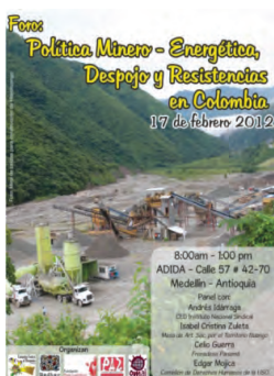
Izquierda: Cartel del Foro Minero-Energético. Colombia

Participamos en diferentes foros sociales, así como en espacios activos por la defensa de los servicios públicos y por la abolición de la deuda externa. Estamos en redes de solidaridad e incidencia política junto a colectivos sociales y ONG, especialmente en aquellas que favorecen procesos de paz en Palestina (Red Solidaria contra la Ocupación de Palestina, entre otros lugares de encuentro) y Colombia (Plataforma Justicia por Colombia, por ejemplo).