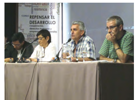
Seminario Universidad Complutense. Madrid (12-14/4/12)