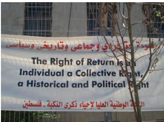
Izquierda: Pancarta por el derecho al retorno. Ramala. Cisjordania. Palestina

En 2012 hemos seguido desarrollando nuestro trabajo en el sector salud tanto en Cisjordania con el Health Work Committee y en la franja de Gaza con la Union Health Work Committee. También seguimos trabajando en el campo de los derechos humanos con Addameer y el Alternative Information Center. Así mismo hemos fortalecido nuestra relación con BISAN (Centro para el Desarrollo y la Investigación).