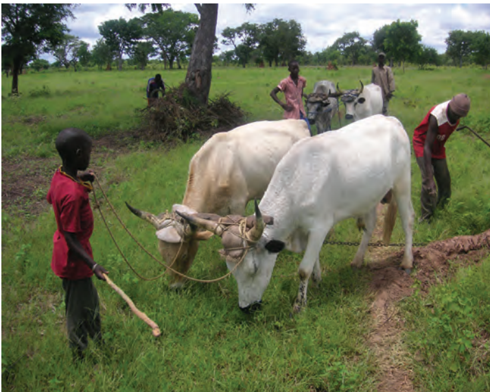
Apoyo a la rizicultura pluvial de las mujeres en las comunidades rurales de Tankanto y Bagadadji. Senegal

Dentro de la misma línea estratégica de intervención en la región de Kolda, hemos iniciado la colaboración con un nuevo socio local, la Asociación Guné. Compuesta íntegramente por personal local de etnia peul. Guné trabaja también en el sector de la soberanía y seguridad alimentaria, la mejora de infraestructuras rurales y la educación al desarrollo. Nuestra colaboración inicia con el proyecto de apoyo a la rizicultura pluvial de las mujeres en las comunidades rurales de Tankanto y Bagadadji.