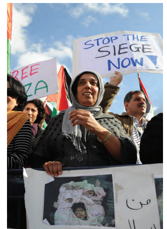
Derecha: Manifestación contra el bloqueo de Gaza. Cisjordania. Palestina

Si te interesa recibir más información acerca de Paz con Dignidad, participar en actividades o asociarte, rellena este formulario y envíanoslo a la dirección: Asociación Paz con Dignidad. C/ Gran Vía, 40, planta 5, of.2. 28013 - Madrid; al fax 915233824 o al correo electrónico: pazcondignidad@pazcondignidad.org.